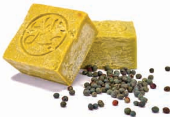
Kehren Sie nicht aus Mardin zurück, ohne diese Seife zu erstehen! Diese Seife mit ihren zahlreichen positiven Wirkungen wird in der südostanatolischen Region vor allem in Siirt und Mardin hergestellt.

vollständig den jungen und älteren Frauen zu, die sie knüpfen. In jedem Knoten verstecken sich unzählige Träume, vielfältige Lebensentwürfe. Jeder Knoten eine Hoffnung ... Wenn Sie nach Mardin kommen, suchen Sie unbedingt diese Teppichknüpferei auf und – brauchen Sie einen Teppich oder möchten Sie ein einzigartiges Geschenk mitbringen – erwerben Sie einen dieser Teppiche! Durch diese modernen, innigen Menschen habe ich mich in Mardin wie in einer Märchenwelt gefühlt. Nachdem ich zurückgekehrt war, wirkten die Eindrücke aus dieser Stadt noch lange nach. Voller Liebe und Glück reiste ich aus dieser schönen Stadt ab und hoffe, sie wiederssehen zu können.