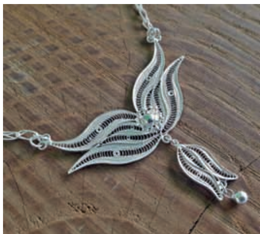
Telkari – eine für Mardin typische filigrane Silberschmiedekunst, die mich in ihrer Feinheit bezauberte ...

Ebenso sind Speisen und Gerichte aus Mardin legendär. Eigentlich hatte ich mich entschieden, mich vegetarisch zu ernähren und seit einem Monat meinen Speiseplan dementsprechend umgestellt, aber den feinen Kebabs in Mardin konnte ich nicht widerstehen. Weiterhin habe ich eine sagenhafte Suppe probiert, die auch Sie unbedingt genießen sollten. Diese ‚Beyran‘ genannte Suppe erhielt ihren Namen von einem Hirten, der seine Frau mit ‚Beyran‘ ansprach. Der Hirte liebte sie so sehr, dass die Geliebte ihm wiederum eine Suppe kochte, deren Zutaten niemandem bekannt sind. Noch heute wird ihr Rezept wie ein Geheimnis gehütet und ist nur jener Familie bekannt. Das heißt, die Männer dieser Region lieben ihre Frauen so sehr, schätzen sie so hoch, dass ihre Liebe in solche Legenden eingeht. Gut, dass auch ich in diese Region, den Südosten, eingehiratet habe.