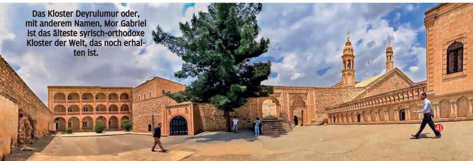
Das Kloster Deyrulmur oder, mit anderem Namen, Mor Gabriel ist das älteste syrisch-orthodoxe Kloster der Welt, das noch erhalten ist.